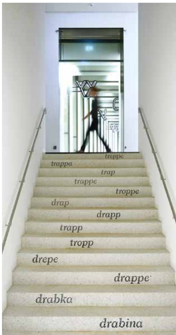
Innenansicht TREPPE, 2015