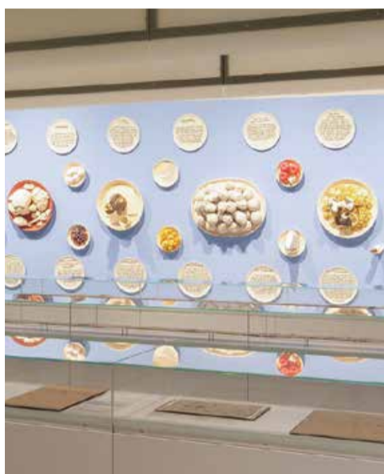
Antoni Miralda, Banquet Table Tales , 2015, QUITTE

Weil die Grimms am Gebrauch der Sprache ansetzten, nahmen sie entgegen der Tradition auch Wörter aus der »zwanglosen, rohen, ungezierten sprache« ins Deutsche Wörterbuch auf: Flüche und Schimpfwörter, Ausrufe und Schallwörter. Neben AUTSCH oder BUMBS, JANHAGEL oder PISSBLUME findet sich etwa auch KRASS, das schon zu Grimms Zeiten als KRAFTWORT gebräuchlich war. Schenken Sie uns ein »anstößiges« Wort von heute und erhalten dafür eines aus dem Grimmschen Wörterbuch!