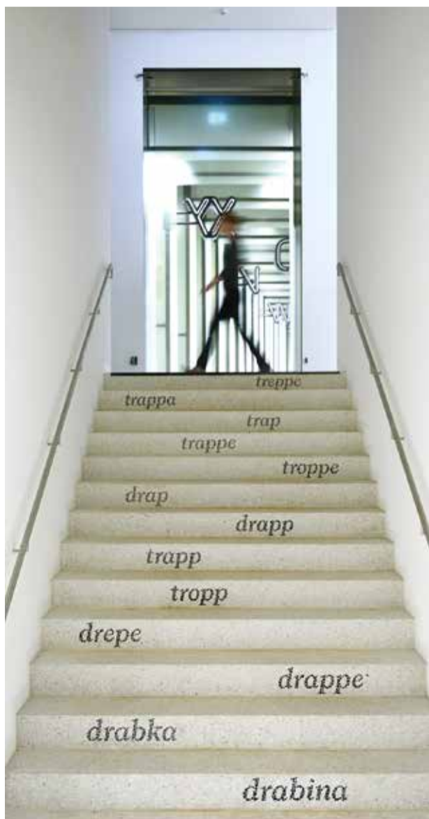
Innenansicht TREPPE, 2015