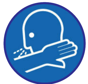
Husten- & Niesetikette beachten