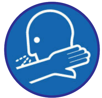
Husten- & Niesetikette beachten