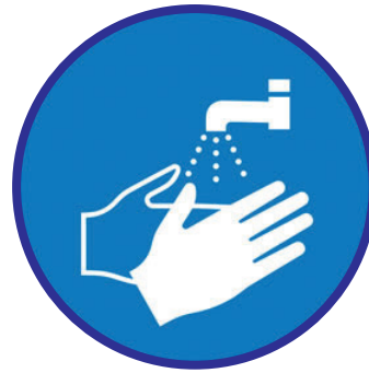
Hände waschen & desinfizieren!